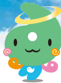
埼玉県社協 マスコット 「シャキたまくん」

社会福祉施設での介護等体験取組の様子や心構えを、直接施設の方から聞いたり、すでに体験をされた学生の体験談を聞いたりして、介護等体験をより有意義なものにしませんか？