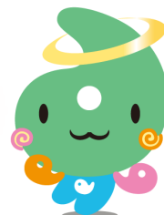
埼玉県社協マスコット 「シャキたまくん」