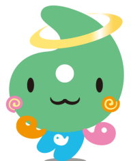
埼玉県社協マスコット 「シャキたまくん」