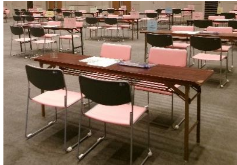
ブースの形状（イメージ）