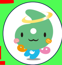
埼玉県社協マスコット 「シャキたまくん」