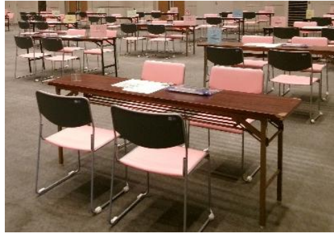
ブースの形状（イメージ）